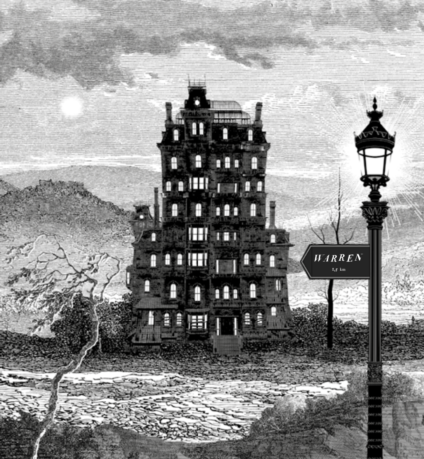
Tania del Rio – Will Staehle (kuv.): Warren 13. ja Kaikkinäkevä silmä Näytesivut kirjasta © Kumma-kustannus & tekijät